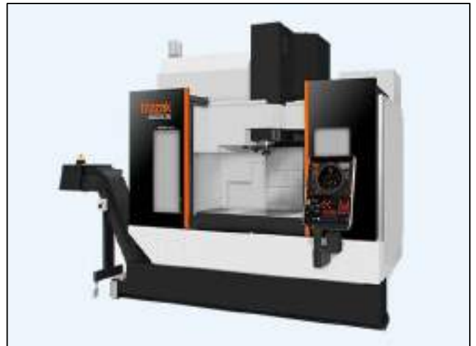
ヤマザキマザック VCN-530C